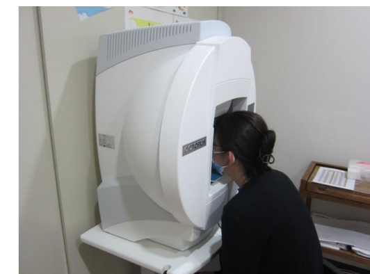
新しく購入した自動視野計。年間約400人の検査に使用。

これまで使用していた自動視野計は、修理のための部品が入手できなくなったため、昨年3月に購入しました。緑内障をはじめとする眼科疾患の診断や経過観察のために使用しています。