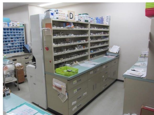
薬事委員会では院内で採用している約1000品目程度の医薬品を管理。

効能や効果、副作用、使用する際に注意すべき事などを検討します。良く似た薬が既に採用されていれば、採用されないこともあります。