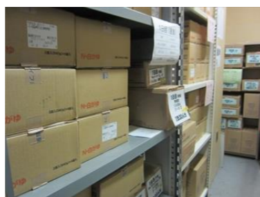
3日分の備蓄食品。提供時に使用する手袋やアルコールなども常備。