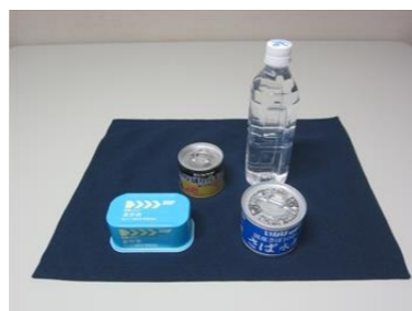
備蓄食品のイメージ。

どこに何がどれだけあるのか保管場所を確認するなどして、非常時になるべくスムーズに対応できるよう実際に保管場所に行って委員で確認をしています。今後は実際に提供する訓練も行いながらもしもの時に備えていきます。