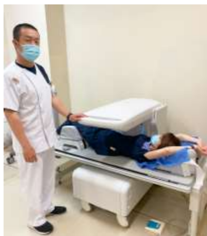
新しくなった骨密度測定装置。腰椎と股関節を撮影し検査します。

健康診断で指摘を受けたかた、気になるかたはまずは当院医師にご相談ください。(結果を持参してください。)