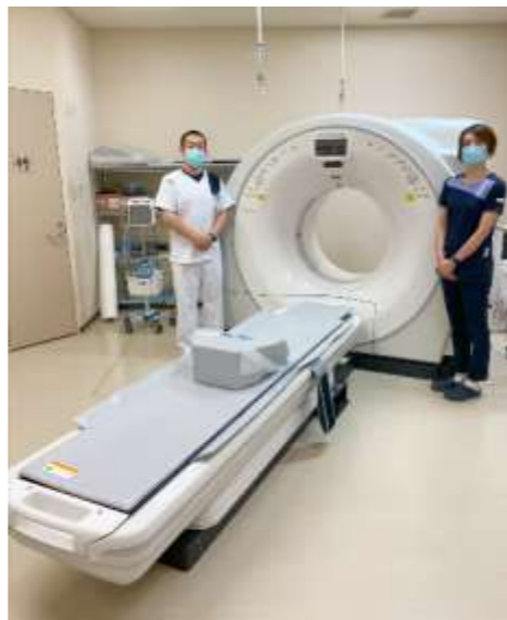
新しくなったCT装置。私たちが診断に最適な画像を撮影します！