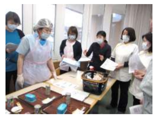
厨房が使用できなくなった想定で、食数確認から、備蓄食の運搬、手指の消毒から備蓄食を提供する一連の流れを確認。