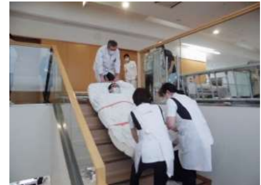
レスキューシートを使用して寝たきりの患者さん役の職員を、2階から1階に降ろす練習。