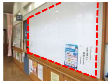
整形外科・耳鼻いんこう科前の待合に掲示物用ボードを整備