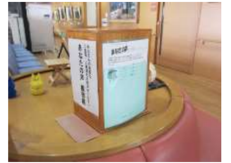
病院入口の「あなたの声投書箱」

「あなたの声」投稿箱は病院入口と病棟ラウンジに設置しています。また、当院のホームページにはお問い合わせフォームも設置していますので、ぜひご利用ください。