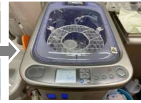
③.内視鏡洗浄消毒装置 内視鏡洗浄消毒装置を使用して仕上げるイメージになります。