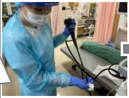
①.ベッドサイド洗浄 ベッドサイド洗浄では、汚れが固着しないようすぐに行います。