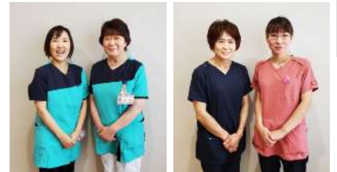
看護師の制服 (薄紫か緑の2種類) 看護助手の制服 (紺かピンクの2種類)

職員の制服が7月1日(金)から新しくなりました。デザイン、色など部署によってそれぞれ異なり、ほぼ全ての職員の制服が変わりました。紙面の都合上、色の違いや全ての制服を紹介できないのが残念ですが、気持ちも新たに地域医療を提供できる体制を整えていきます。