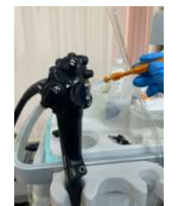
内視鏡スコープを ATP 検査用綿棒で拭き取りし検体を採取