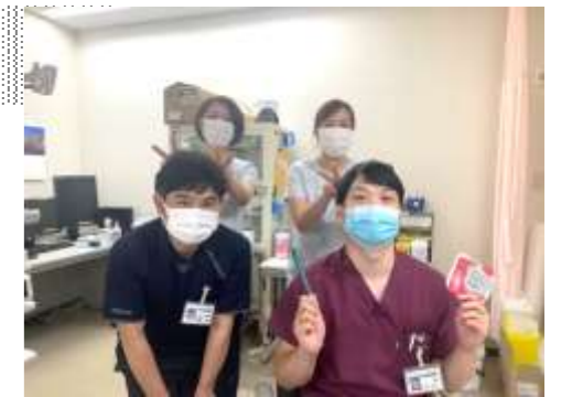
令和3年度内視鏡検査に関わる職員と

新型コロナウイルスが猛威を振るっていますが、患者さんが安心して内視鏡検査を受けられるよう、引き続き高い水準で清浄度を維持するよう努めていきます。