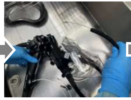
②.用手洗浄 用手洗浄では、管になっている部分のブラッシングが重要な操作になります。内部をしっかり洗浄する事が求められます。