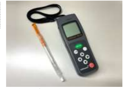
ATP 検査に使用した機器

当院のマニュアルどおりに洗浄・消毒する行程のうち、 ①使用直後 ②用手洗浄後 ③内視鏡洗浄消毒装置完了後 の3つの場面で、ATP ふき取り検査を実施しました。