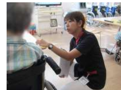
摂取状況を確認しながら、積極的なコミュニケーションで不安を少しでも和らげたい

入院している患者さんは特に不安が強いので、食事を通して積極的に声掛けし、話すことで不安が和らぐように努めています。