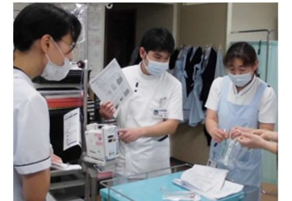
看護師などの院内の職員に対して医療機器の取り扱いについての説明も行う。

当院では、主な臨床業務として、胃カメラや大腸カメラなどの内視鏡検査・治療にかかる業務を行っています。医師のサポートをしつつ、患者様が安心して検査や治療を受けられるよう、検査前から検査後まで細やかな視点で安全管理に取り組んでいます。また、院内の各種医療機器の点検、職員を対象とした医療機器の研修会なども実施しています。