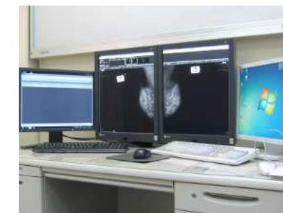
診察室に配備された診断用モニタ。より鮮明で詳細な画像が瞬時に表示

乳がんは、早期発見であれば治癒する可能性が大幅に高まります。早期発見のために定期的に乳がん検診を受けましょう。