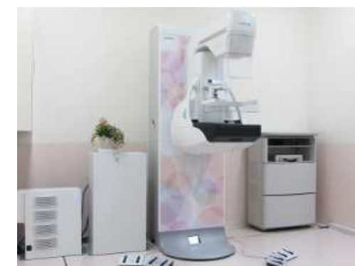
新しくなったマンモグラフィX線撮影装置

さらに、撮影室にも明るくやさしい淡いピンク色の壁紙を貼るなど、皆様にリラックスして検査を受けていただけるような雰囲気づくりに努めました。