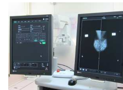
撮影した画像は撮影室ですぐ確認が可能