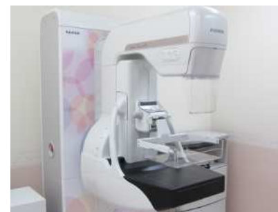
装置と壁紙はやさしい色づかいに