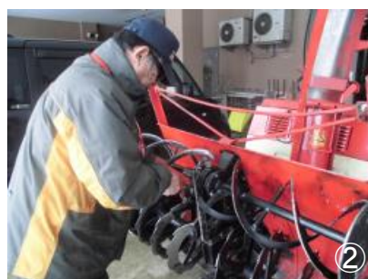
②冬季は除雪機のメンテナンスを行いながら、除雪作業を行う。