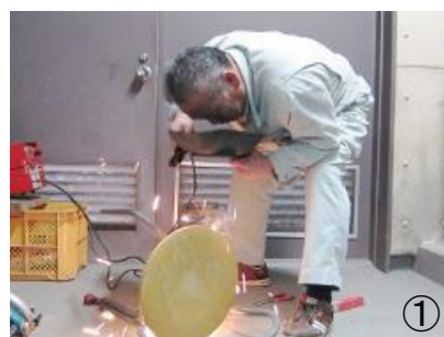
①備品を溶接して修理。