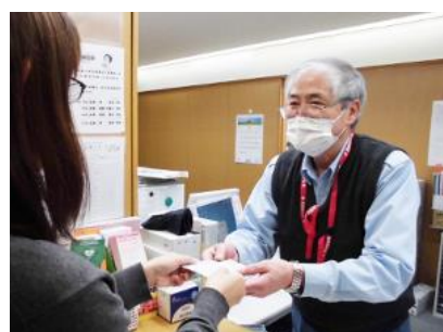
時間外は私たちが受付対応しています。