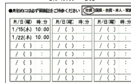
次回の予約を記入します