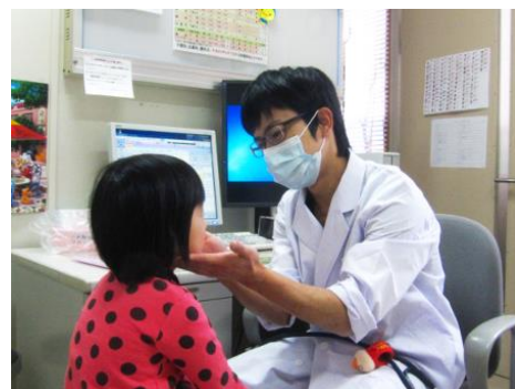
診療の様子 (症状を説明できるかたの付き添いをお願いします)

母子手帳・予診票は、予防接種を受ける上での大切な情報となります。忘れずに持参してください。