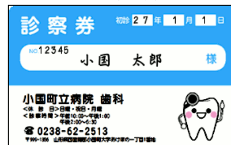
カルテ番号と名前が表面に記入されています