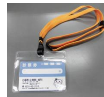
パスケースは受付に準備しています