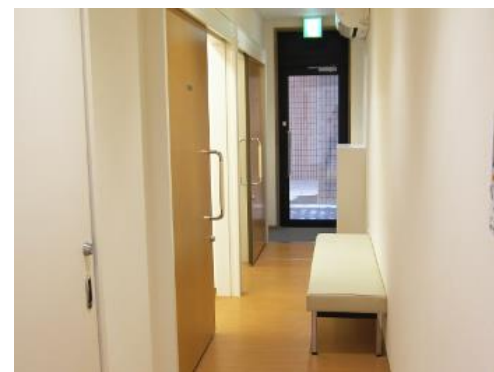
リハビリ棟内の発熱外来待合

冬は、インフルエンザ・ノロウイルスなどの流行期です。これらの流行に対応するため、今年は新しく「発熱外来」スペースを開設いたします。発熱の症状で受診されたかたは、受付窓口で熱があることを伝えていただきますと「発熱外来」へご案内し、検査や診察をさせていただきますのでご利用ください。