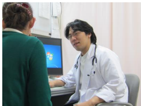
内科での診療の様子

しかし、連休明け等で予約外の患者さんが多い場合や、医師が救急対応にあたるため診療を中断する場合などは、予約でもお待ちいただくことがありますので、ご理解ください。